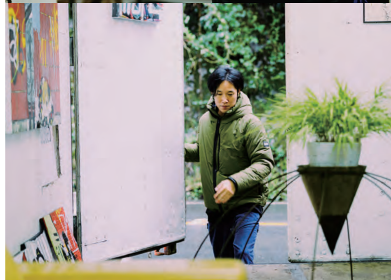
Wizard Jacket DC150 Overland Jacket DC150