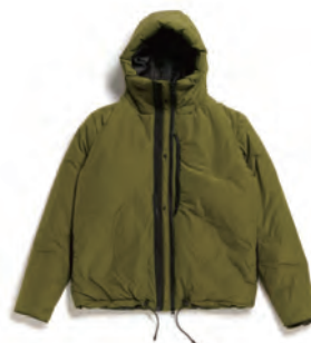
Overland Jacket DC150