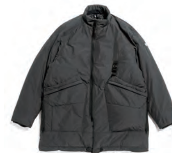
Wizard Jacket DC150